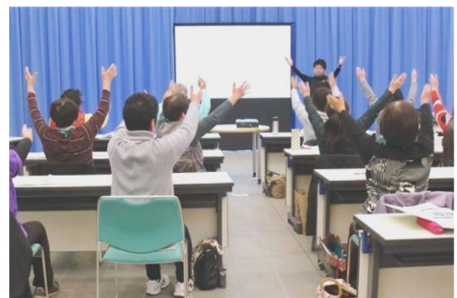
健康セミナーの様子