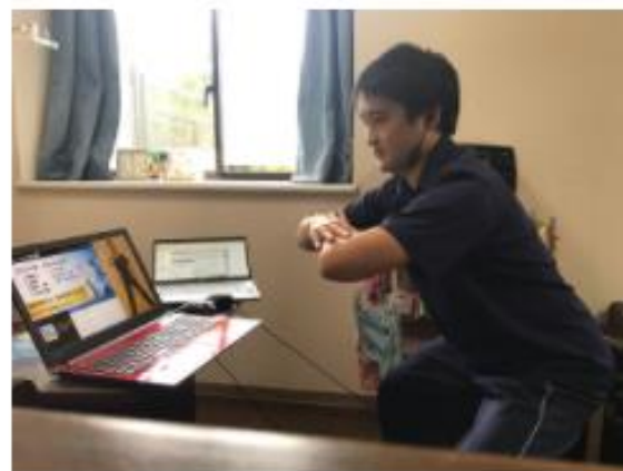
※セミナー受講イメージ