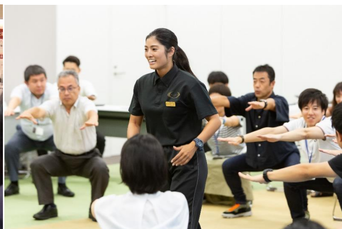
RIZAP ウェルネスプログラムの様子