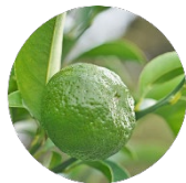
沖縄県産 シイクワシャー果皮水