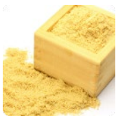
米ぬか発酵エキス* 3