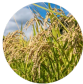
加水分解イネ葉エキス

低分子の植物性ナノ成分 3 種と加水分解成分 5 種を贅沢に配合し、角質層の奥深くに潤いをグングン浸透させます。