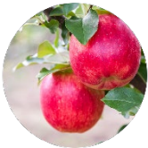
青森県産 リンゴ果実水