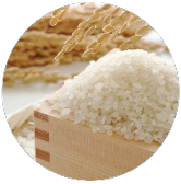
加水分解コメエキス