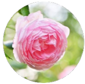
ダマスクバラ花油