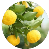
高知県産 ゆず果皮エキス