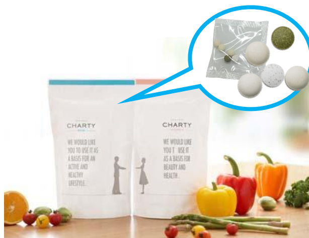
チャーティシリーズを並べると、カップルがお互いの手を取り合うようなデザインです。

国内の工場にて、徹底した衛生管理のもとで製造しています。未来の赤ちゃんのために、毎日安心して飲んでいただけるよう、安心・安全の品質にこだわりました。