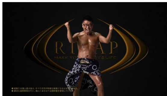
【RIZAP 公式 HP にて動画公開】・『BA 生島ヒロシ』篇: http://www.rizap.jp/cm/